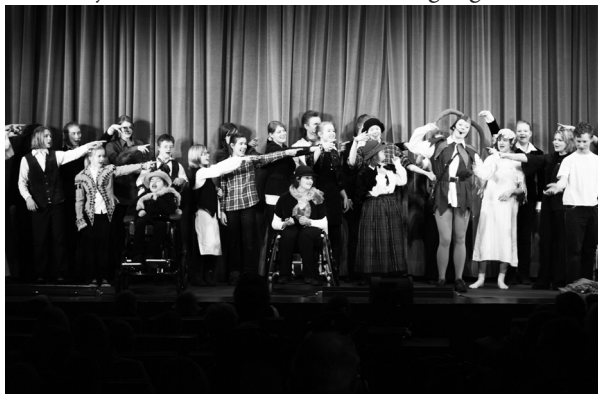
Theater Integrale: „1-2-3- Eulenspiegel“

In unserer Schule arbeiten wir nun bereits intensiv an den Vorbereitungen für das neue Schuljahr und an weite-